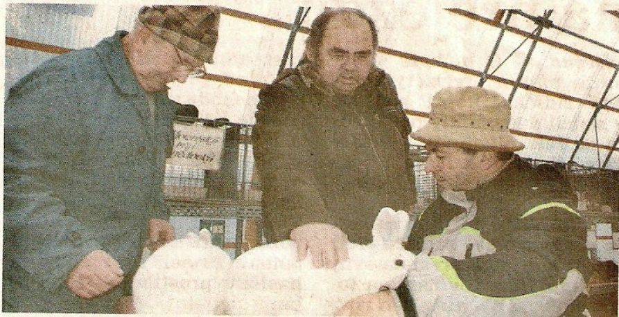
VÝSTAVA. Chovatelé představili plemena vyšlechtěná právě v prostějovském regionu.

Prostějov – Přes dvě stě holubů a bezmála šedesát králíků bylo v sobotu k vidění na okresní výstavě, kterou v Plumlovské ulici uspořádali prostějovští chovatelé.